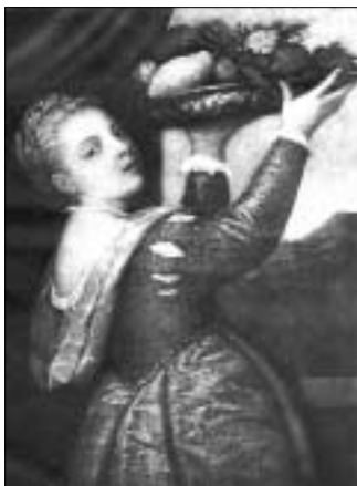
Тициан. Девушка с фруктами

Да, есть и такие! Самые многочисленные – музеи Хлеба. Один из старейших расположен в зернохранилище старой мельницы возле Парижа. Почти 1000 его экспонатов рассказывают посетителям про достижения хлебопёков. Тут есть модель древнеегипетского зернохранилища, образцы древних форм для хлеба, а также рецепты его выпекания в разных странах мира